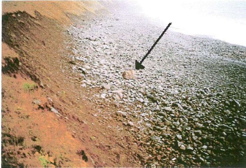
Mynd 2. Grjótið staðnæmdist í fjörunni fyrir neðan veginn