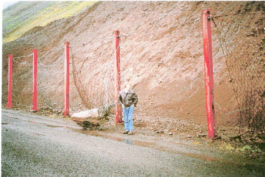
Mynd 6. Grjót í einu grjóthrunsnétinu í Óshlíð