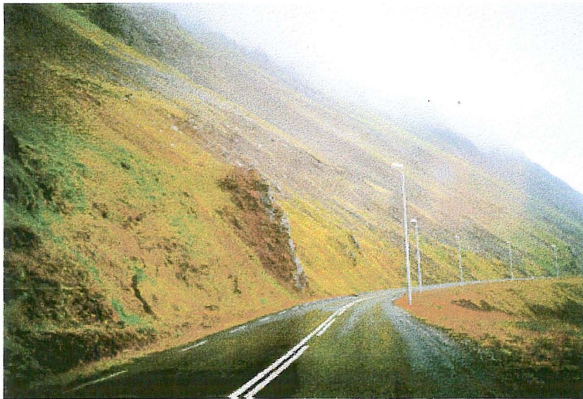
Mynd 1. Grjótið fór yfir kletthrygginn og lenti á hægri akrein