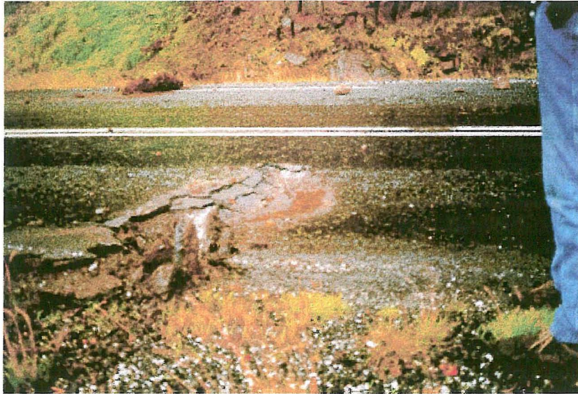
Mynd 4 Skarðið sem myndaðist í veginum