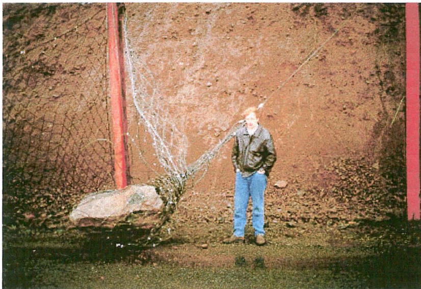
Mynd 7 Sjá má að netið er illa farið eftir atburðinn