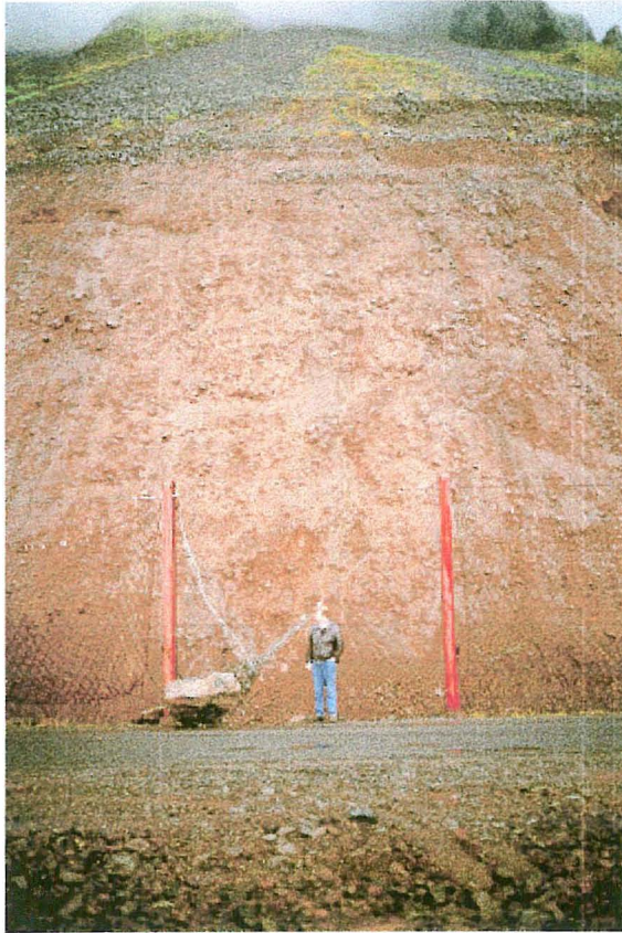
Mynd 8 Horft upp í snarbrattan skriðuvænginn þar sem grjótið kom niður