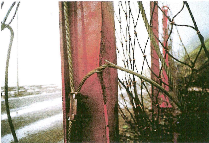
Mynd 9. Jaðarvírar slitnuðu og I-stálbitar bognuðu