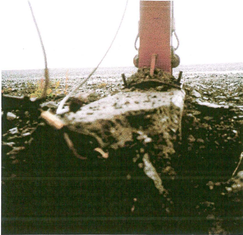
Mynd 10. Við höggið brotnaði úr steiptum undirstöðum I-stálbitanna og nokkrir boltar losnuðu