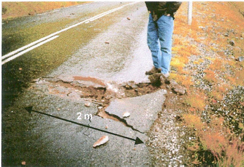
Mynd 3. Skarðið sem myndaðist í veginum